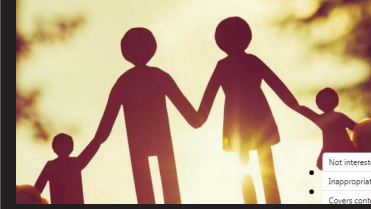
ਸਾਡੇ ਮੁਹੱਲੇ ਦੀ ਇਕ ਅਰੋੜ ਦੇ ਦੋ ਬੇਟੇ ਹਨ ਅਤੇ ਦੋ ਬੇਟੀਆਂ। ਵੱਡੀ ਬੇਟੀ ਦਾ ਘਰ ਛੋਟਾ ਸੀ, ਜਿਸ ਕਰਕੇ ਵਿਆਹ ਸਮੇਂ ਉਸ ਨੂੰ ਉਨਾ ਕੁ ਦਾਜ ਦਿੱਤਾ, ਜਿੰਨਾ ਉਸ ਦੇ ਘਰ ਰੱਖਿਆ ਜਾ ਸਕਦਾ ਹੋਵੇ। ਹੁਣ ਵੱਡੀ ਬੇਟੀ ਨੇ ਮਕਾਨ ਵੱਡਾ ਕਰ ਲਿਆ ਹੈ ਅਤੇ ਉਹ ਉਸ ਨੂੰ ਆਪਣੇ ਜੱਤੇ ਪੈਸਿਆਂ ਨਾਲ ਡਬਲ ਬੱਡ, ਅਲਮਾਰੀ, ਫਰਿਜ਼ ਆਦਿ ਲੈ ਕੇ ਦੇ ਆਈ ਹੈ। ਵੱਡੀ ਬੇਟੀ ਵੀ ਵੱਡੀ ਵਾਂਗ ਚੀਜ਼ਾਂ ਦੀ ਮੰਗ ਕਰ ਰਹੀ ਹੈ ਪਰ ਉਸ ਦਾ ਘਰ ਵੀ ਛੋਟਾ ਹੈ, ਜਿਸ ਕਰਕੇ ਉਹ ਵੱਡੀ ਬੇਟੀ ਨੂੰ ਕਹਿੰਦੀ ਹੈ ਕਿ ਉਹ ਉਸ ਦੇ ਬੱਚਿਆਂ ਦੇ ਨਾਂ ਪੈਸੇ ਜਮ 'ਚ ਕੀ ਕਰਵਾ ਦਿੰਦੀ ਹੈ। ਨੂੰ ਇਸ ਤੋਂ ਇਤਰਾਜ਼ ਕਰਦੀਆਂ ਹਨ ਪਰ ਅਰੋੜ ਕਹਿੰਦੀ ਹੈ ਕਿ ਉਸ ਨੇ ਤੁਹਾਡੇ ਪਾਸੋਂ ਤਾਂ ਪੈਸੇ ਨਹੀਂ ਲਏ। ਮਿਹਨਤ ਤੋਂ ਮਜ਼ਦੂਰੀ ਕਰਕੇ ਉਸ ਨੇ ਪੈਸੇ ਜੱਤੇ ਹਨ, ਉਹ

ਸਾਡੇ ਮੁਹੱਲੇ ਦੀ ਇਕ ਅਰੋੜ ਦੇ ਦੋ ਬੇਟੇ ਹਨ ਅਤੇ ਦੋ ਬੇਟੀਆਂ। ਵੱਡੀ ਬੇਟੀ ਦਾ ਘਰ ਛੋਟਾ ਸੀ, ਜਿਸ ਕਰਕੇ ਵਿਆਹ ਸਮੇਂ ਉਸ ਨੂੰ ਉਨਾ ਕੁ ਦਾਜ ਦਿੱਤਾ, ਜਿੰਨਾ ਉਸ ਦੇ ਘਰ ਰੱਖਿਆ ਜਾ ਸਕਦਾ ਹੋਵੇ। ਹੁਣ ਵੱਡੀ ਬੇਟੀ ਨੇ ਮਕਾਨ ਵੱਡਾ ਕਰ ਲਿਆ ਹੈ ਅਤੇ ਉਹ ਉਸ ਨੂੰ ਆਪਣੇ ਜੱਤੇ ਪੈਸਿਆਂ ਨਾਲ ਡਬਲ ਬੱਡ, ਅਲਮਾਰੀ, ਫਰਿਜ਼ ਆਦਿ ਲੈ ਕੇ ਦੇ ਆਈ ਹੈ। ਵੱਡੀ ਬੇਟੀ ਵੀ ਵੱਡੀ ਵਾਂਗ ਚੀਜ਼ਾਂ ਦੀ ਮੰਗ ਕਰ ਰਹੀ ਹੈ ਪਰ ਉਸ ਦਾ ਘਰ ਵੀ ਛੋਟਾ ਹੈ, ਜਿਸ ਕਰਕੇ ਉਹ ਵੱਡੀ ਬੇਟੀ ਨੂੰ ਕਹਿੰਦੀ ਹੈ ਕਿ ਉਹ ਉਸ ਦੇ ਬੱਚਿਆਂ ਦੇ ਨਾਂ ਪੈਸੇ ਜਮ 'ਚ ਕੀ ਕਰਵਾ ਦਿੰਦੀ ਹੈ। ਨੂੰ ਇਸ ਤੋਂ ਇਤਰਾਜ਼ ਕਰਦੀਆਂ ਹਨ ਪਰ ਅਰੋੜ ਕਹਿੰਦੀ ਹੈ ਕਿ ਉਸ ਨੇ ਤੁਹਾਡੇ ਪਾਸੋਂ ਤਾਂ ਪੈਸੇ ਨਹੀਂ ਲਏ। ਮਿਹਨਤ ਮਜ਼ਦੂਰੀ ਕਰਕੇ ਉਸ ਨੇ ਪੈਸੇ ਜੱਤੇ ਹਨ, ਉਹ ਜਿੱਥੇ ਮਰਜ਼ੀ ਖਰਚ ਕਰੇ। ਧੀਆਂ ਦਾ ਘਰ ਵਸਾਉਣ ਦੀ ਡੱਗ ਨਾ ਪਿਛੇ ਨੂੰ ਹੈ, ਨਾ ਭਰਾਵਾਂ ਨੂੰ, ਸਿਰਫ਼ ਮਾਂ ਨੂੰ ਹੈ ਅੱਜਕਲ ਮੋਬਾਇਲ ਦਾ ਜੁੱਗ ਹੈ। ਧੀਆਂ ਰੱਜ ਆਪਣੇ ਮਾਪਿਆਂ ਨਾਲ ਮੋਬਾਇਲ 'ਤੇ ਗੱਲ ਕਰਦੀਆਂ ਹਨ ਅਤੇ ਘਰਦੀਆਂ ਸਾਰੀਆਂ ਨਿੱਕੀਆਂ-ਮੋਟੀਆਂ ਗੱਲਾਂ ਮਾਪਿਆਂ ਤੱਕ ਪਹੁੰਚਾਉਂਦੀਆਂ ਹਨ। ਕੋਈ ਟਾਂਕੀ ਮਾਂ ਹੀ ਅੱਜਕਲ ਹੁੰਦੀ ਹੈ ਜੋ ਆਪਣੀ ਧੀ ਨੂੰ ਡਾਂਟਦੀ ਹੈ ਕਿ ਸਹੁਰੇ ਘਰ ਦੀਆਂ ਗੱਲਾਂ ਕੋਲ ਹੀ ਰੱਖਿਆ ਕਰ। ਮੈਨੂੰ ਯਾਦ ਹੈ ਮੇਰੇ ਸੱਸ-ਸੁਹਰੇ ਨੇ ਮੇਰੀ ਪਤਨੀ ਨੂੰ ਇਹ ਸ਼ਖ਼ਤ ਹਦਾਇਤ ਕੀਤੀ ਸੀ ਕਿ ਪੇਕੇ ਆਉਣਾ ਹੋਵੇ ਤਾਂ ਰਾਜ਼ੀ-ਬਾਜ਼ੀ ਆਵੀ, ਲੜ ਕੇ ਪੇਕੇ ਆਉਣ ਦੀ ਲੋੜ ਨਹੀਂ ਅਤੇ ਸਹੁਰੇ ਘਰ ਦੀ ਕੋਈ ਗੱਲ ਪੇਕੇ ਸਾਂਝੀ ਨਾ ਕਰੀ।