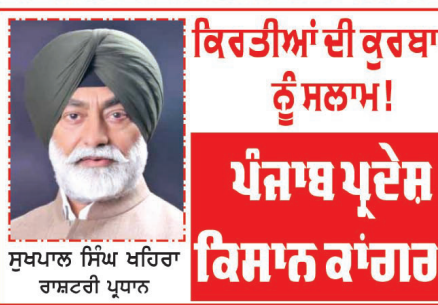
ਸੁਖਪਾਲ ਸਿੰਘ ਖਹਿਰਾ ਰਾਸ਼ਟਰੀ ਪ੍ਰਧਾਨ